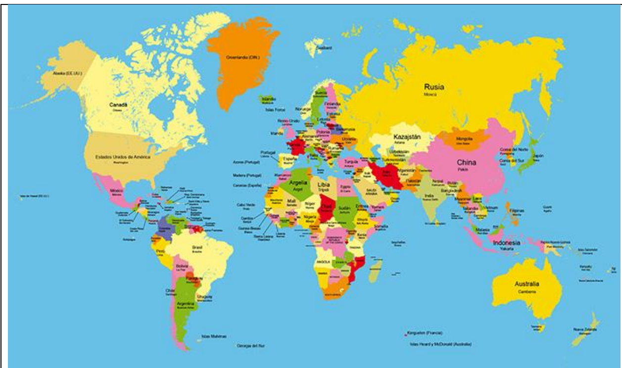
Mapamundi división política