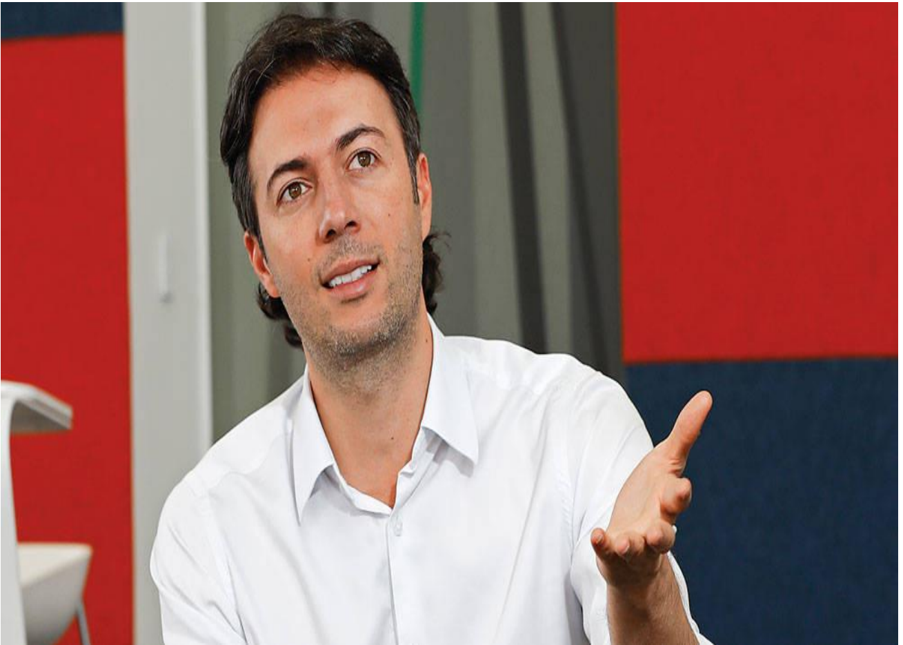
Alcalde de Medellín, Daniel Q uintero Calle

Q uintero, Q uintero, Q uintero, Q uintero, Q uintero, Q uintero, Q uintero, Q uintero