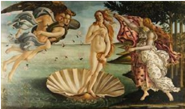
El Nacimiento de Venus por Sandro Botticelli - Año: 1486

Humanismo, Antropocentrismo, Mecenazgo, Genio, Sfumato, Manierismo, Vitruvio, Donatello, Palladio, Escuela veneciana.