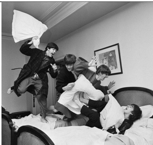
"La Pelea de Almohadas", Harry Benson, 1964

Reflexiona sobre las siguientes fotografías, ¿Qué sensaciones te transmite?, ¿qué te comunica?, ¿qué piensas? Dialoguemos en el encuentro de clase. ¿Sabes la historia detrás de las fotografías?