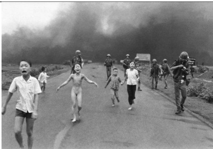
El Terror de la Guerra", Nick Ut, 1972

Durante el desarrollo de esta guía, trabajaremos con tres elementos principales: teoría, práctica e investigación. En el recorrido de este camino dialogaremos sobre el arte en el renacimiento, asimismo, se trabajará en la práctica sobre fotografía básica en dispositivos y elementos de composición. En la sección de investigación se abordarán temas como la escuela Bauhaus, y el op art, entre otros.