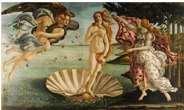
El Nacimiento de Venus por Sandro Botticelli - Año: 1486

Para iniciar esta guía se abordará el tema del arte en el renacimiento, donde analizará algunos aspectos importantes sobre los aportes de este periodo centrado en el humanismo y sus cambios en arquitectura, arte. También se dialogará sobre algunos personajes sobresalientes como: Leonardo da Vinci, Miguel Ángel Buonarrotti, Brunelleschi, etc.