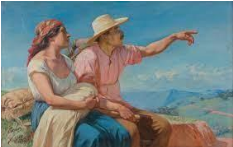
Obra: Horizontes Francisco Antonio Cano