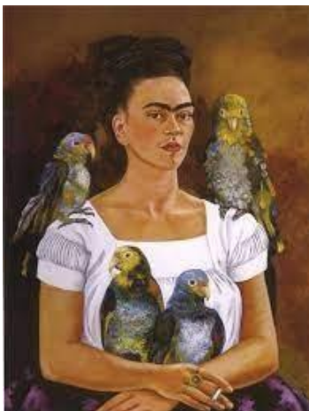
Obra 2 Yo y mis pericos