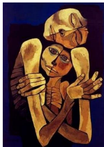
Obra 3. Ternura