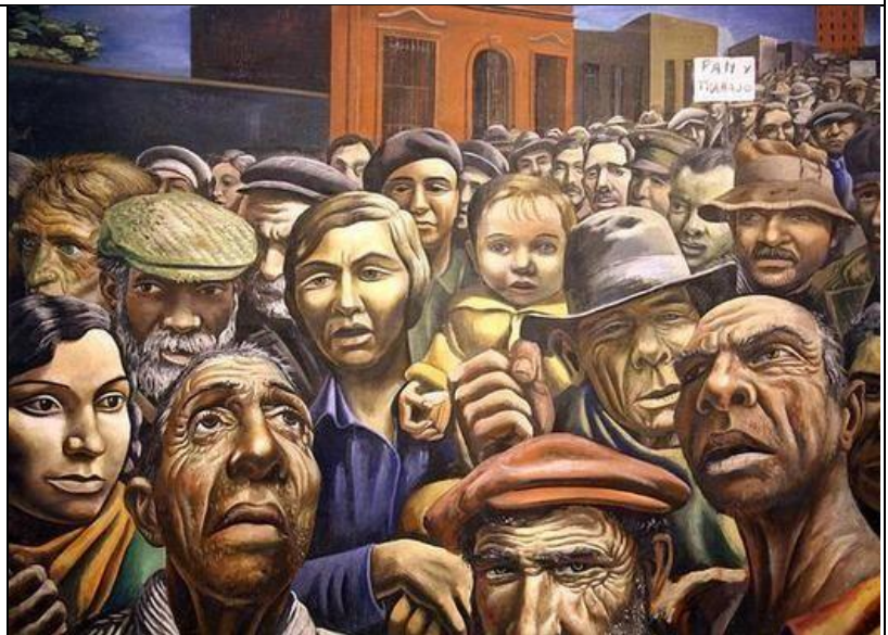
Mural de Antonio Berni -Argentina