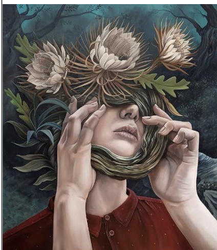
Obra 1 El secreto de las flores