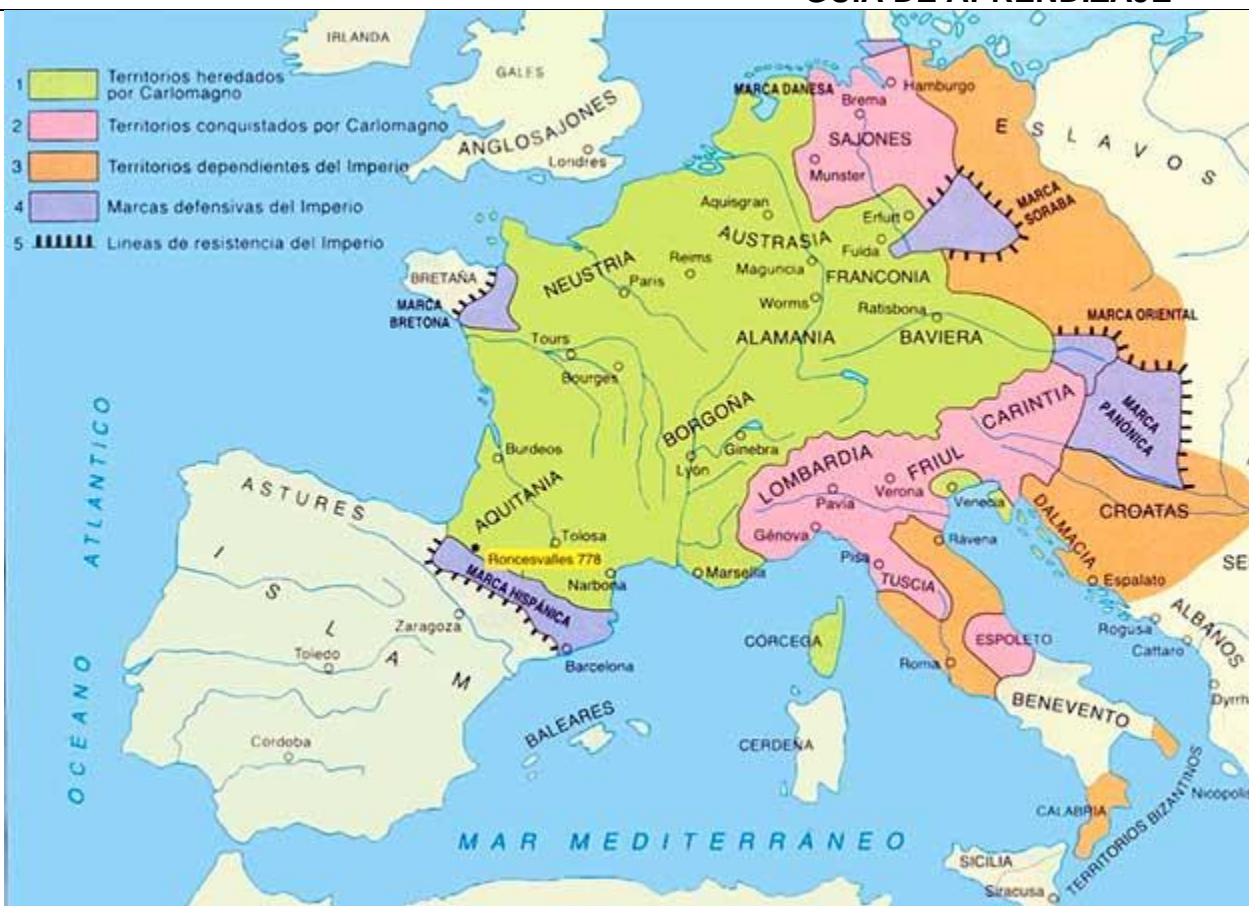
Mapa del Imperio Carolingio

El Imperio Carolingio se sintió profundamente romano y cristiano, pero su modelo de organización fue germano. Carlomagno gobernó su imperio de manera absoluta, al estilo de los emperadores romanos. Sin embargo los hombres libres de su imperio se reunían dos veces al año, al modo germano, en una asamblea que aprobaba las leyes llamadas capitulares.