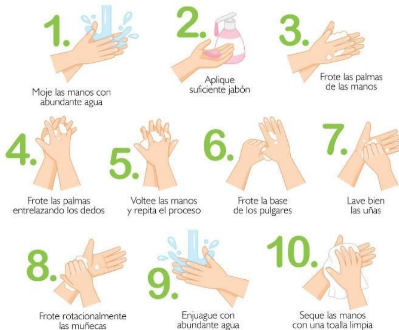
Ilustración 1. Higiene de manos.

Si todos lavamos las manos frecuentemente, podemos reducir hasta el 50% de los casos de las infecciones respiratorias, incluyendo Coronavirus COVID-19 .