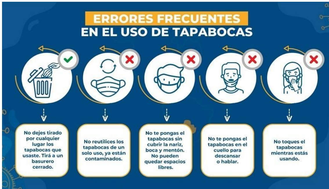
Ilustración 3. Errores frecuentes en el uso del tapabocas.