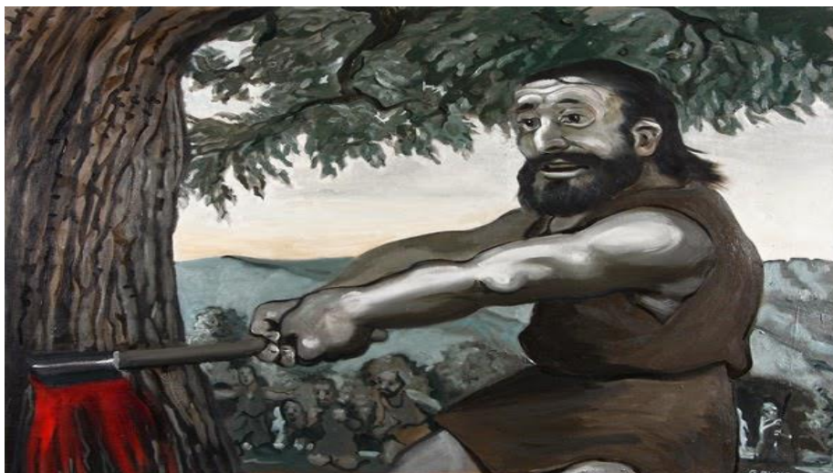
Ericsitón. Rey de Tesalias.

El hambre, aunque siempre es contraria a las obras de Ceres cumple su mandato: un viento la transporta por el aire hasta la casa indicada, se dirige inmediatamente a la habitación del sacrílego y mientras que él estaba sumido en un profundo sueño, pues era de noche, lo rodea son sus brazos y se insufla dentro de él, sopla en su boca, en su garganta y en su pecho y difunde su apetito por el conducto de sus venas.