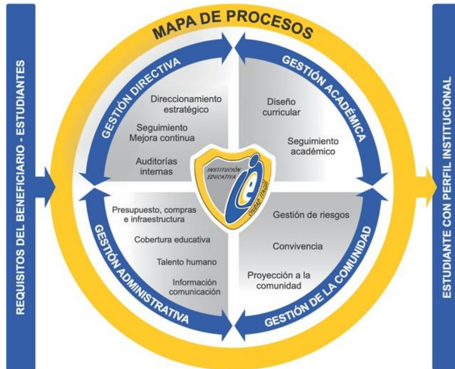
Gráfica 4.2 Mapa de procesos institucional

La comprensi3n y gesti3n de los procesos interrelacionados como sistema contribuye a la eficacia y eficiencia de la instituci3n educativa en el logro de sus resultados previstos, por lo tanto, la definici3n y gesti3n sistemática de éstos y sus interacciones se ven reflejadas en las caracterizaciones establecidas para cada proceso.