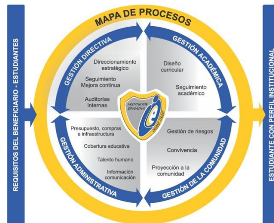
Gráfica 4.2 Mapa de procesos institucional

La comprensión y gestión de los procesos interrelacionados como sistema contribuye a la eficacia y eficiencia de la institución educativa en el logro de sus resultados previstos, por lo tanto, la definición y gestión sistemática de éstos y sus interacciones se ven reflejadas en las caracterizaciones establecidas para cada proceso.