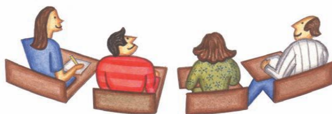
Imagen guía 26 del Ministerio de Educación Nacional.