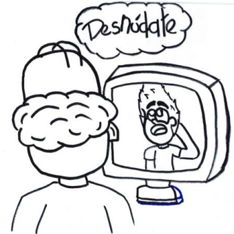
Ilustración: Tomás González G. 7º2

Comportamientos sexuales sin contacto directo: Mostrar material pornográfico a un menor; exhibir los genitales delante de un menor; pedir a un menor que interactúe sexualmente con otro; seducir a un menor a través de Internet, teléfono, carta, para propósitos sexuales; fotografiar a un menor en posiciones sexuales; exponer al menor a ver actos sexuales de personas adultas en presencia física; observar al menor desnudo mientras se viste o utiliza el baño, para obtener placer sexual, hablar sobre temas obscenos cara a cara o a través del teléfono o de Internet.