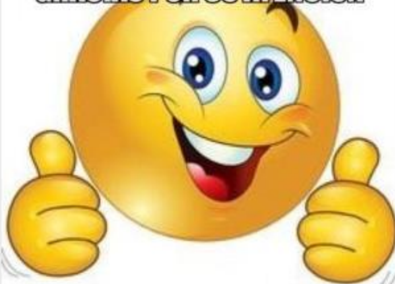
Imagen creada en GeneradorMemes.com