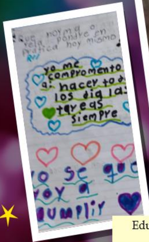
Educación ética Quinto