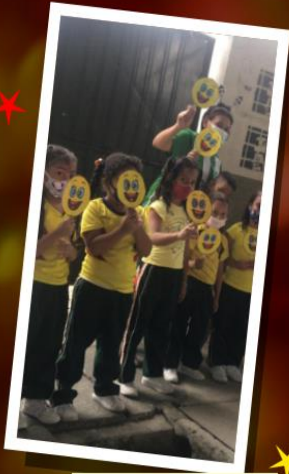
Dimensión estética Preescolar