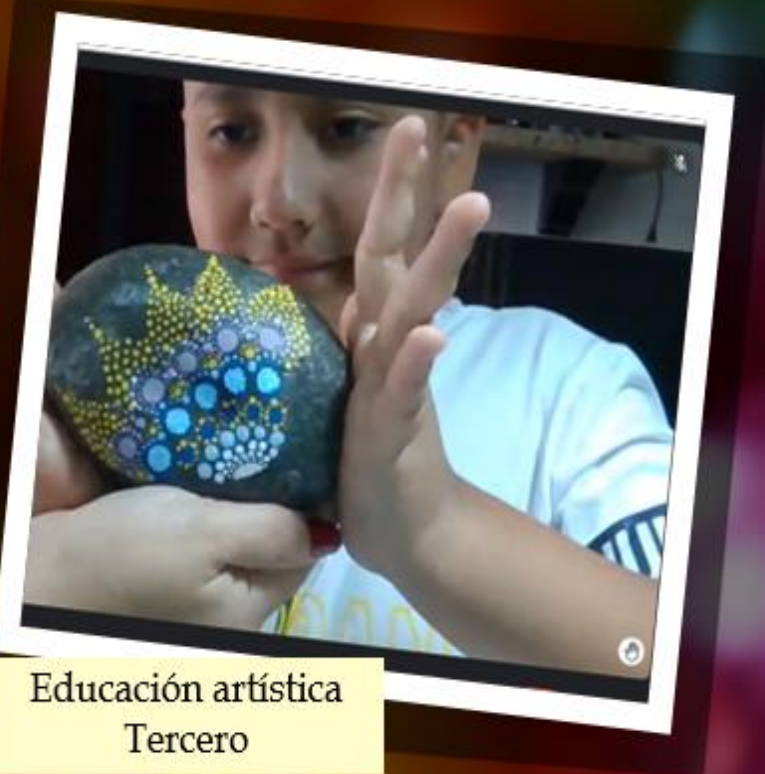
Educación artística Tercero

Educación artística Aceleración del Aprendizaje