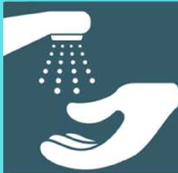
Lavado de manos

Las medidas que han demostrado mayor evidencia para la protección contra este virus y que serán adoptadas por la empresa 2020 ALIMENTOS son: