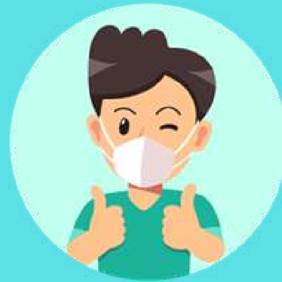
Uso de tapabocas