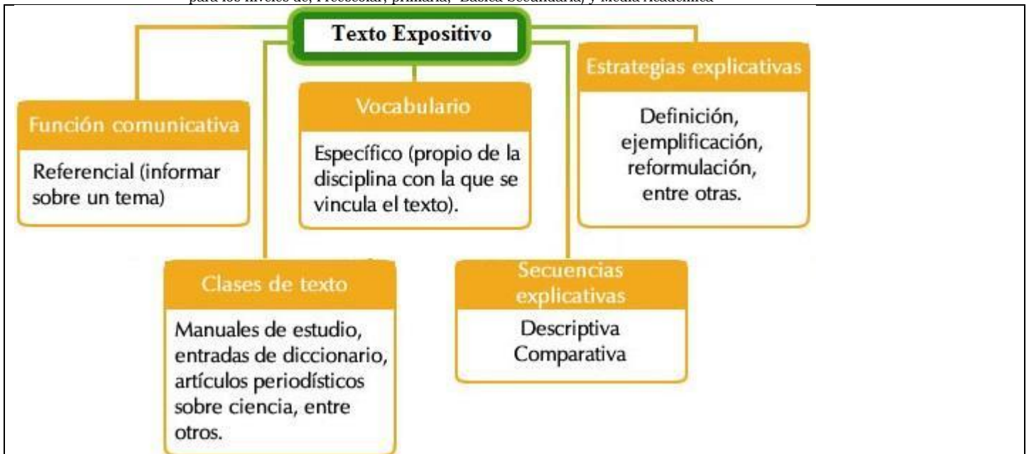
Imagen: Ejemplo de características de un texto expositivo

Establecimiento oficial autorizado definitivamente por Resolución N°. 9932 de Noviembre 16 de 2006. para los niveles de; Preescolar, primaria, Básica Secundaria) y Media Académica