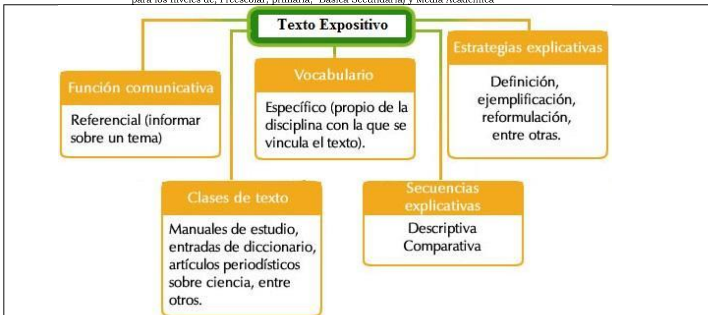
Imagen: Ejemplo de características de un texto expositivo

Establecimiento oficial autorizado definitivamente por Resolución N°. 9932 de Noviembre 16 de 2006. para los niveles de; Preescolar, primaria, Básica Secundaria) y Media Académica