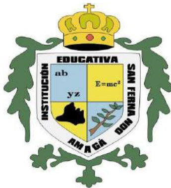
Imagen 1. Escudo Institucional