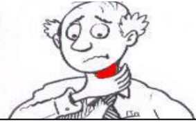
He has a sore throat

1. Escribe el nombre de cada enfermedad en el cuadro utilizando el verbo “have” como en el ejemplo