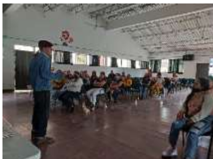
Capacitación con AGNUR a padres migrantes