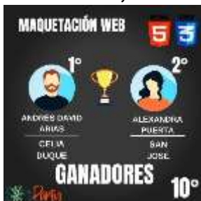
Participación de estudiantes en la Tecno academia.

PARTICIPACIÓN DE ESTUDIANTES: Los estudiantes de la institución educativa participan en diferentes espacios a nivel municipal, departamental o nacional en actividades deportivas, culturales, científicas, académicas, entre otras,