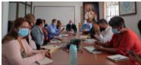
Comité rectores Marinilla.

AGENDAS INSTITUCIONALES: Para mayor información y mejorar la comunicación se establecen el proceso de entrega y fijación de los cronogramas más relevantes y de interés para la comunidad.