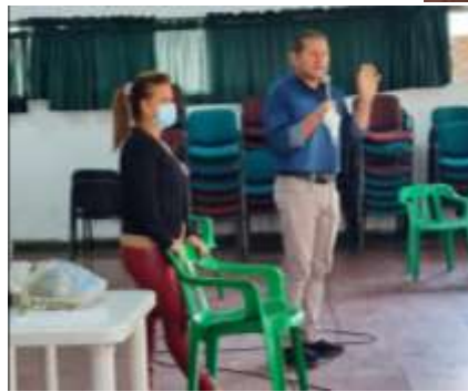
Inicio año lectivo