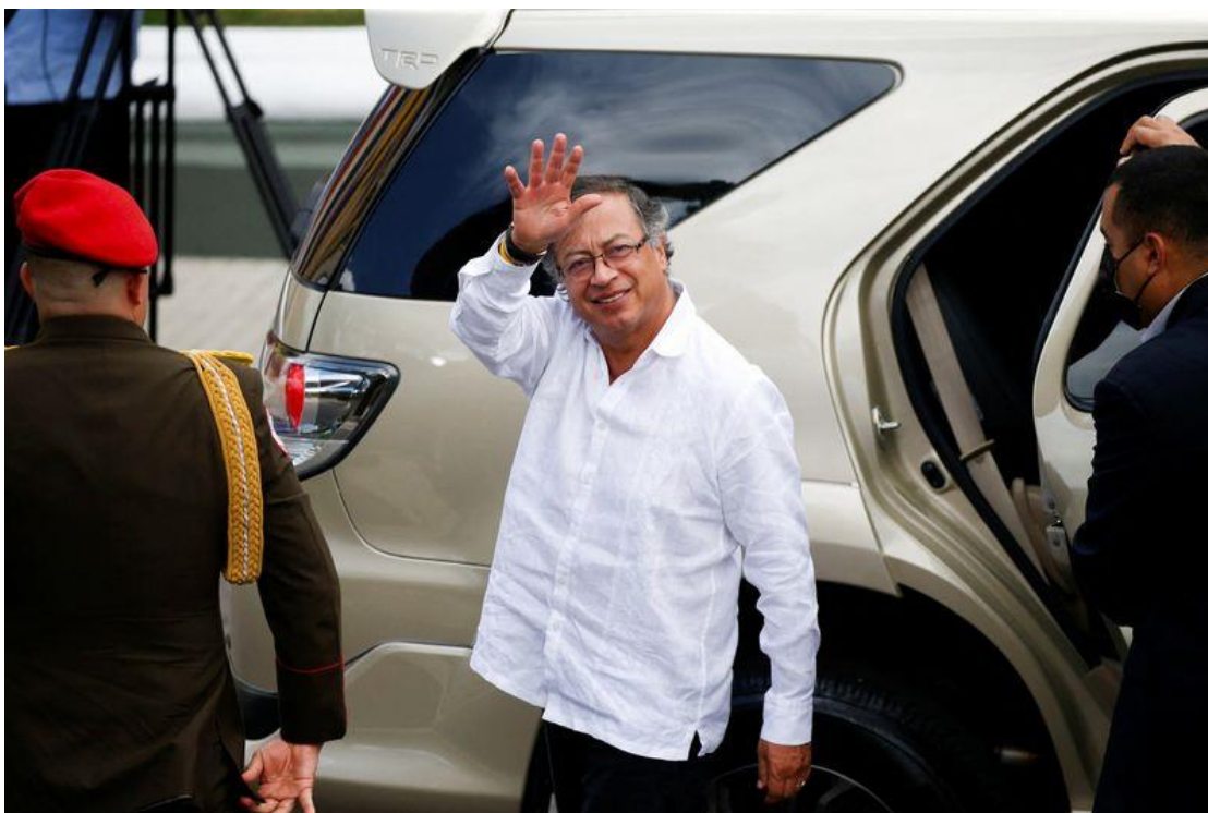
El presidente de Colombia, Gustavo Petro, hace gestos el día de la reunión con el presidente de Venezuela, Nicolás Maduro, en el Palacio de Miraflores, en Caracas, Venezuela, el 7 de enero de 2023.

El presidente de Colombia viajará para participar en el Foro Económico Mundial, acompañado por varios ministros. Al mandatario le quedan dos viajes más en enero.