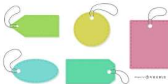
EJEMPLO DE ETIQUETAS

Tarea 5. Realiza un dibujo, de cómo estaría distribuido un supermercado. Lo puedes realizar en cartulina, cartón paja, papel kraft, entre otros.