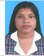
TENORIO CASTAÑO CA ANDEA