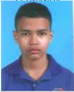
PIEDRAHITA ECHAVARRIA MAYOR ESTEBAN