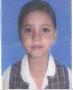
BRAND GIRALDO ISABELLA