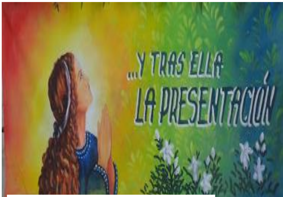
Pintura del Profesor Luis Gonzalo Londoño Vélez