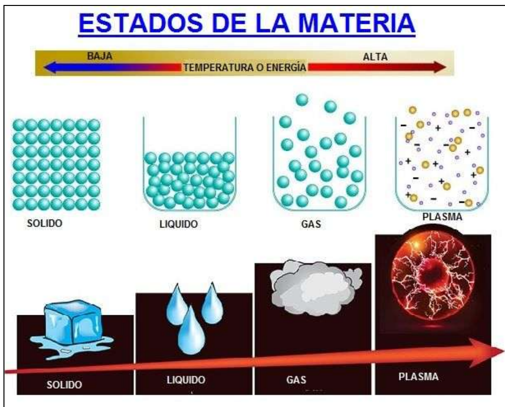
FIGURA 1. Estados de la materia

La intensidad de las fuerzas de cohesión entre las partículas que constituyen un sistema material (porción de materia que pueda delimitarse y ser estudiada en forma individual) determina su estado de agregación. Cuando un sistema material cambia de estado de agregación, la masa permanece constante, pero el volumen cambia. Modificando sus condiciones de temperatura o presión, pueden obtenerse distintos estados o fases.