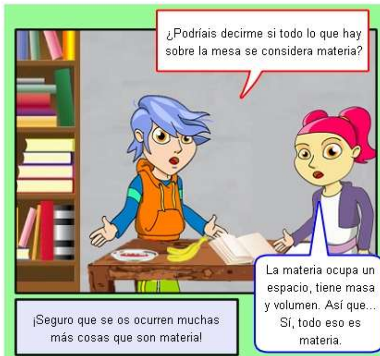
FIGURA 3. La materia en nuestras vidas.