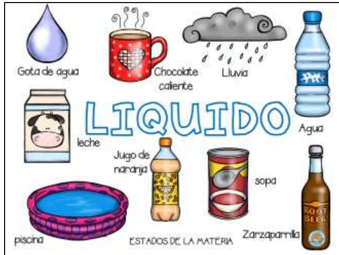
FIGURA 2. Ejemplo de estado de la materia y sus usos cotidianos.